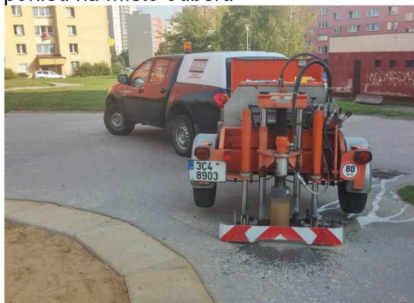
pohled na místo odběru